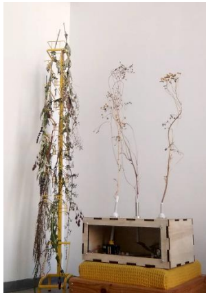
Lucía Batalla, Circumnutaciones (2025)