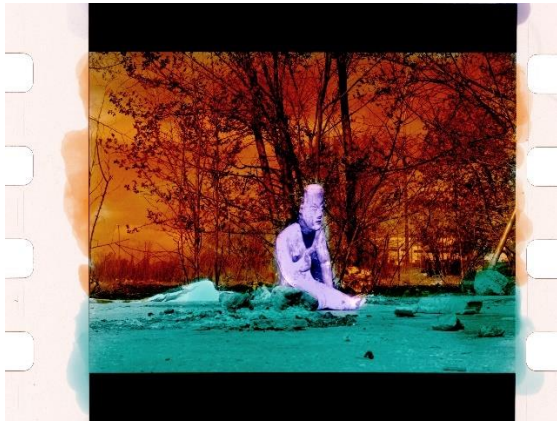
Gonzalo Mon, Amigas viejas de las que no sé nada (2024) Instalación