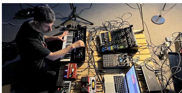
Residencia Andrés Rodríguez Monteavaro

Espacio de 122 metros cuadrados, acondicionado para trabajos musicales y equipado con diferentes recursos técnicos: altavoces, mesa de mezclas y micrófonos. El LABoratorio de Sonido es un espacio para la experimentación y producción de obras a través de residencias de artistas sonoros/os y músicas/os tanto emergentes como establecidas/os, quienes trabajarán en el desarrollo de piezas enmarcadas dentro de las prácticas sonoras y musicales de la creación contemporánea.