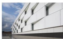
Organización y estatutos