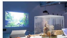
Jardin de micelios 2022 Matthias Fritsch