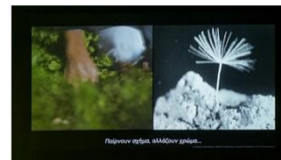
Mawat 2017 Abelardo Gil-Fournier