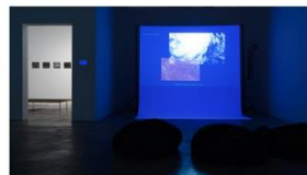
Souvenirs entomológicos #1: odonata / datos metereológicos 2020 Sybille Neumayer