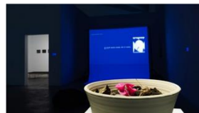
Tiempo de ruptura, Ecos del Palaeo-plasticeno 2021 Kat Austen