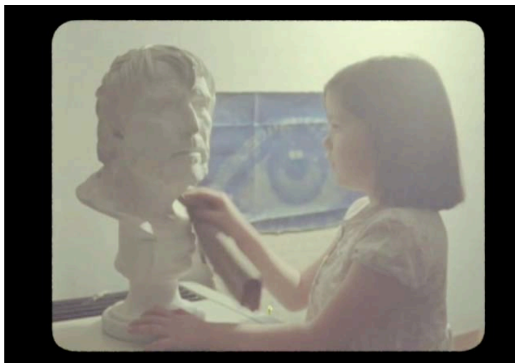
Velasco Broca. Val del Omar fuera de sus casillas