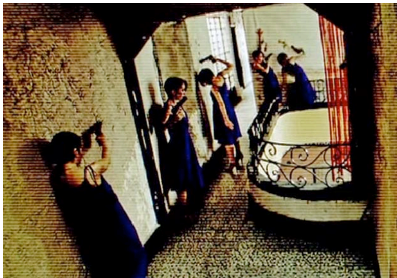
Tensa calma , 2008. Alfredo Salomón. HD