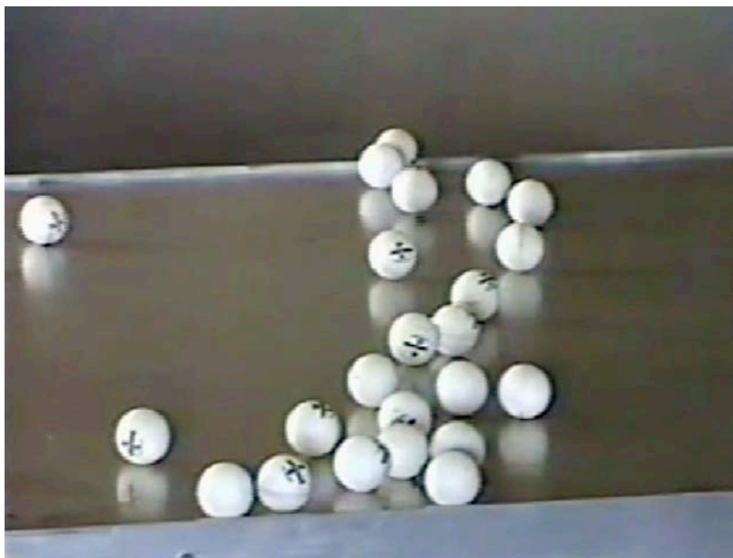
Ping Roll , 1977. Manuel Rocha Iturbide. Mini DV, 1997

No sabemos si el término de arte sonoro es un género nuevo, pero ayuda para relacionar una serie de disciplinas que se encuentran en periferias interdisciplinarias. Debido a la ambigüedad de estos campos, este comisariado usó el recurso de definir grupos de trabajo para conjuntar obras no sólo contemporáneas, sino también aquellas que cimentaron las bases del arte sónico actual. Éstos son: Arte Sonoro, en donde se encuentran obras híbridas que van desde lo conceptual hasta la escultura y la instalación, e incluso la música electroacústica experimental. En el formato de documentación en vídeo incluimos obras que no podrían explicarse sin el componente visual temporal, como son las acciones