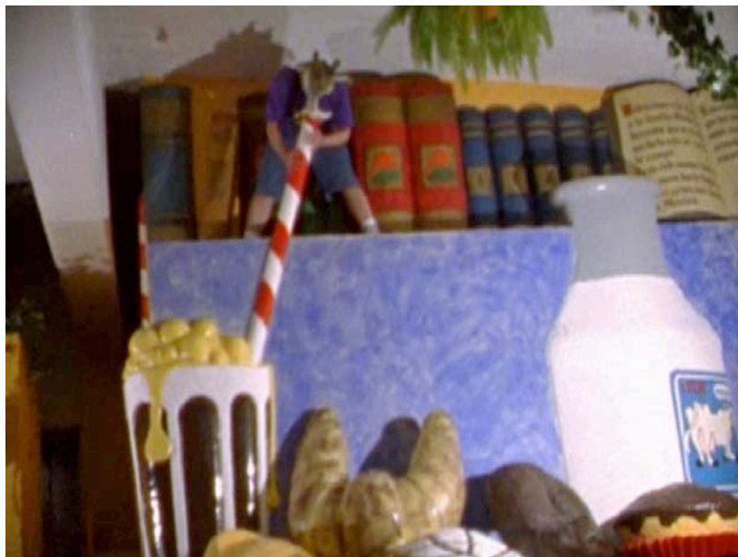
Sexabrate , 2007. Txema Novelo. 16mm

En la última década, el cine experimental en México ha crecido y diversificado, rejuvenecido por la entrada nuevos realizadores y la exploración de nuevas formas y técnicas. El ciclo Cine povera es una revisión breve de algunas de estas nuevas expresiones. Después de un largo periodo de decline, el cine comercial mexicano (es decir, la industria de cine) de la última década ha tenido bastante éxito, tanto económico como artístico, gracias a los mejores presupuestos de producción, entre otros factores. Los cineastas representados aquí optan por una ruta distinta; en vez de costos de producción cada vez más altos, ellos prefieren