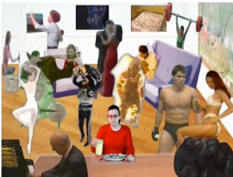
Invasión doméstica , 2002, Paulina del Paso. DV

Este programa busca ofrecer un panorama del cine experimental, alternativo e independiente en el México contemporáneo. Enfocado en la producción realizada a partir de Mexperimental 1 , integra también algunos trabajos anteriores. Se entiende por “experimental contemporáneo” una variedad de prácticas cinematográficas y videográficas alternas (contraculturales a nivel formal), así como la búsqueda de formas de producción y distribución posibilitada a partir de nuevas tecnologías.