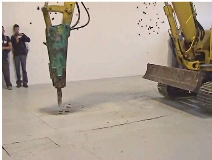
S O S , Enrique Jezik, 2002. Mini DV. 6'02"

En las llamadas “sociedades de la información” las tecnologías mecánicas parecen haber perdido su carácter protagonista en el imaginario social y cultural, como si soñáramos, desde hace tiempo, con prescindir de aquellos dispositivos que de modo visible y directo transforman la energía natural en trabajo. En parte, las tecnologías de la comunicación instantánea han configurado el mundo como un espacio para la acción a distancia y en red. Gracias a ellas el flujo de información se ha vuelto más