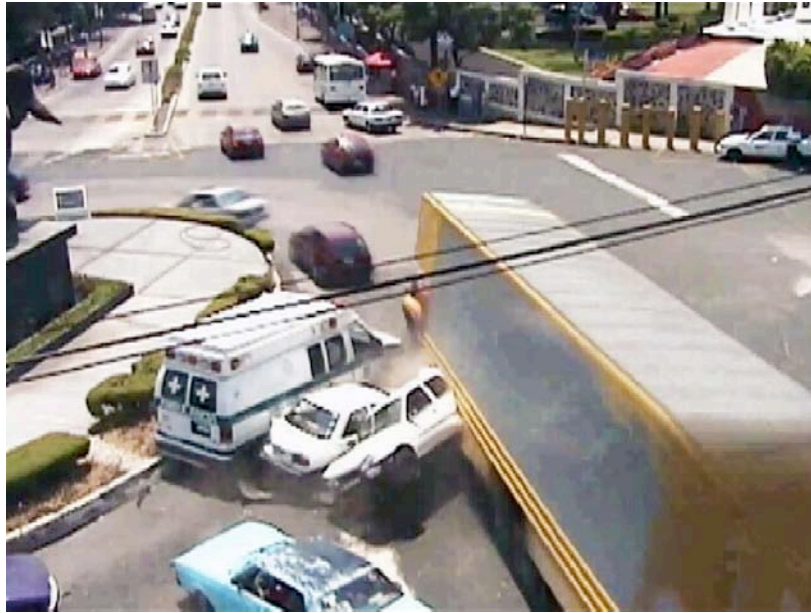
Panóptico , 2006. Roberto Reyes. DV