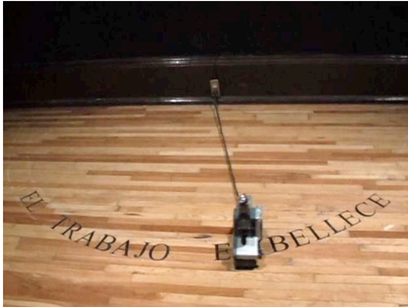
El trabajo embellece , 2007, Gilberto Esparza. Mini DV. 2'22"