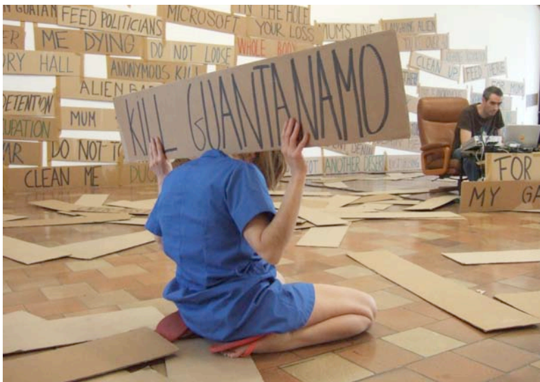
La Ribot. Laughing Hole , 2006