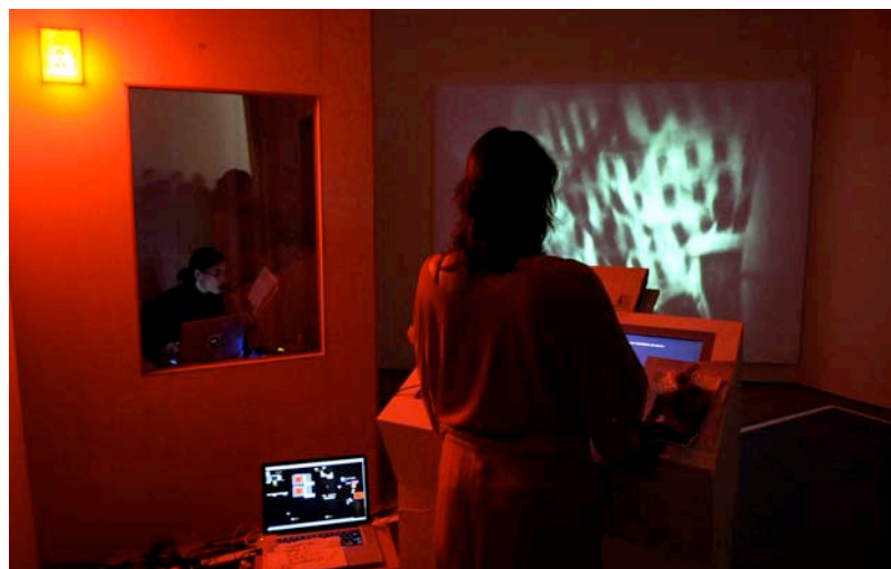
SUE-C + AGF. Infinite Jest [La broma infinita] , 2012