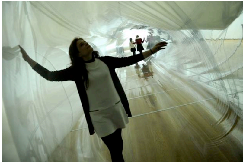
Sergio Prego. Sin título , 2011