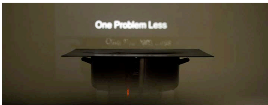
Maja Bajević. Slogans Remix , 2012