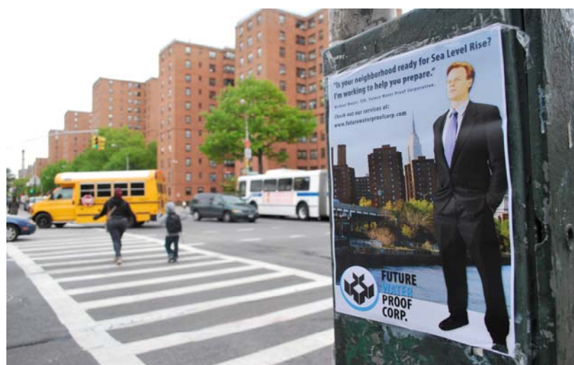
Drowning Prosperously (2010). Paolo Cirio Instalación